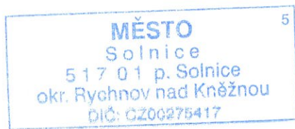
Jana Šulcová Stavební technička

Zároveň Vám sdělujeme, že v zájmovém území stavby se nachází podzemní vedení veřejného osvětlení, které je v našem majetku.